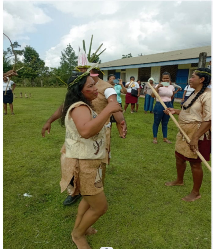
Elementos culturales del King Pulanka

Actualmente, el King Pulanka constituye una de las manifestaciones culturales más importantes del pueblo miskitu, considerada un espacio de encuentro comunitario, transmisión de saberes ancestrales y reafirmación de la identidad cultural.